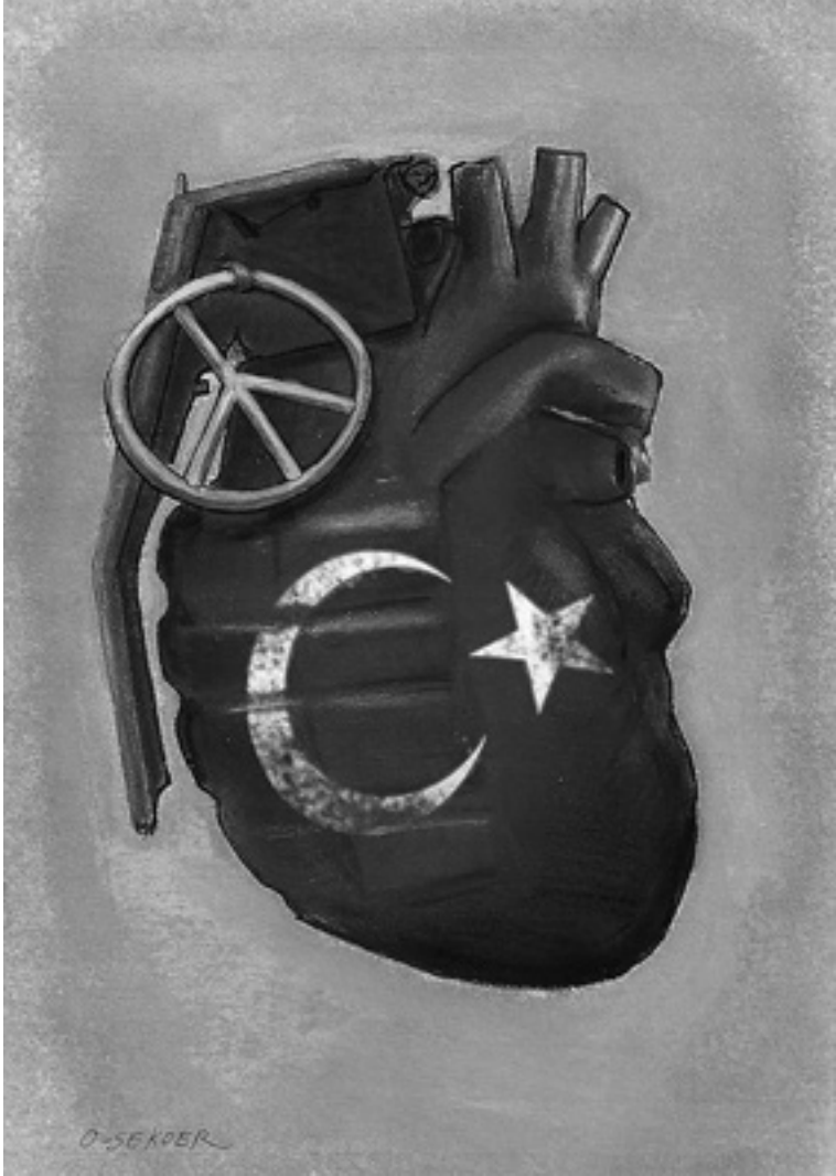
Belçikalı çizer Luc Descheemaeker'in kaleminden...