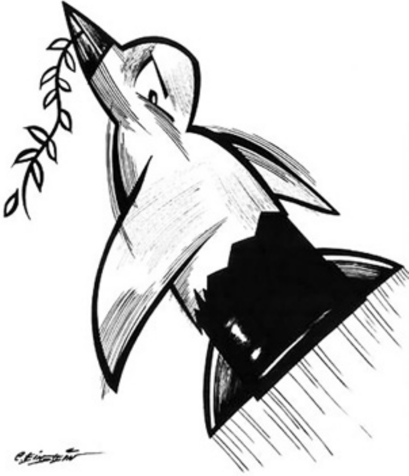
Brezilyalı karikatürist Cival Einstein ise Ankara'daki saldırıyı böyle gördü.